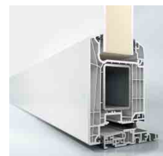
Schüco LivIng Haustür, nach außen öffnend

Erhöhte Anforderungen an die Sicherheit können mit dieser Türschwelle – genau wie bei Fenstern gelöst werden. So ist Einbruchhemmung bis Widerstandsklasse 2 (RC2) möglich.