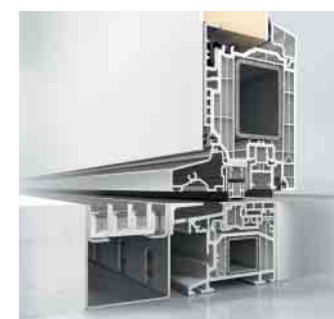
Schüco LivIng Haustür, nach innen öffnend

Mit der innovativen 0mm-Türschwelle von Schüco gehören selbst kleinste Stolperfallen der Vergangenheit an. Die bodenebene Schwelle bietet maximale Barrierefreiheit für Ihre nach innen öffnenden Haus- und Nebeneingangstüren aus dem Schüco LivIng System. Da kein Trittschutzprofil zur Schmutzbeseitigung entnommen werden muss, ist eine besonders leichte Reinigung möglich. Auch in puncto Wärmedämmung müssen Sie keine Abstriche machen. Die plane 0mm-Schwelle ist thermisch getrennt, sodass Wärmeverluste zuverlässig verhindert werden.